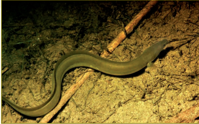
Anguila al Canal des Sol

llissa i l'anguila i els sistemes de pesca variaven segons l'espècie, l'època i el lloc on s'instal·laven. S'esmenten la pesca amb canya, amb diversos tipus de xarxa, com la xarxa esmallada, de ratera o tresmall, la xarxa de caluper (el calup és una llissa de casta petita) i amb diversos estris que se situaven als canals de pas, com els butxells, que probablement eren un tipus d'almadrava.