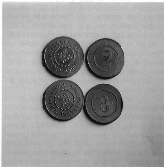
Monedes pròpies (Albufera Sociedad Anónima) Own money