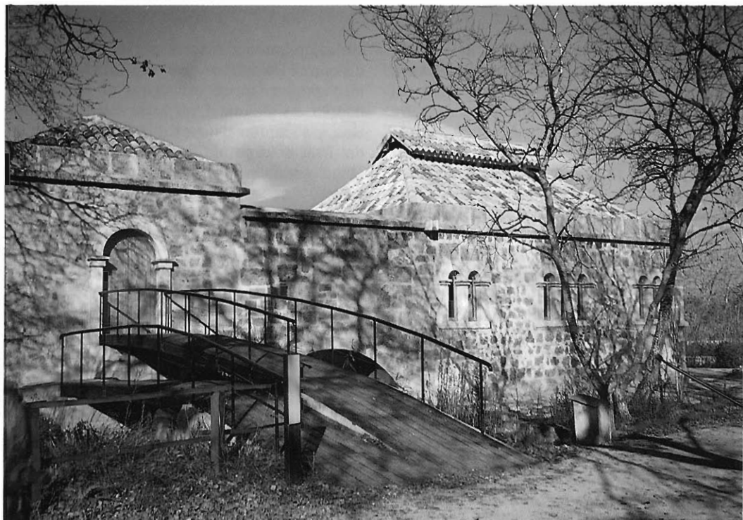
Centre d'interpretació i antiga casa de l'enginyer Bateman, "Ca'n Bateman". Interpretation center and house formerly occupied by the engineer Bateman, "Ca'n Bateman".

del nom de Gatamoix pel de la Colònia de Sant Lluís, 11 encara que també era coneguda popularment per "Poble Nou".