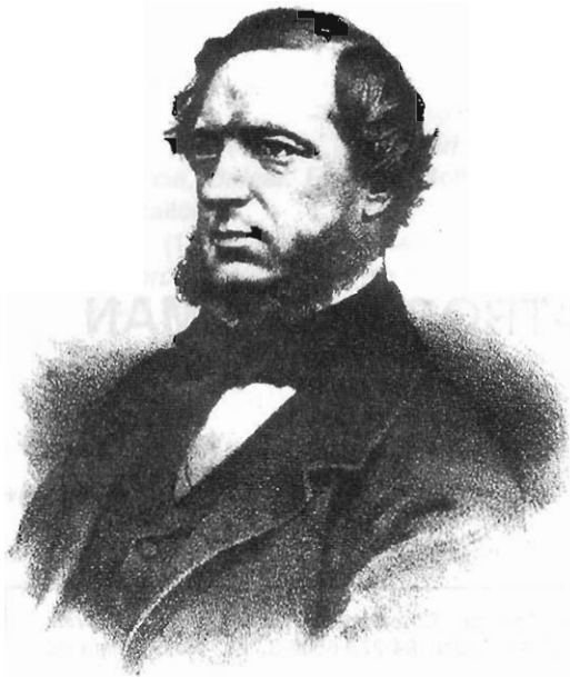
John Frederic Latrobe Bateman als 49 anys John Frederic Latrobe Bateman 49 years old (1859)