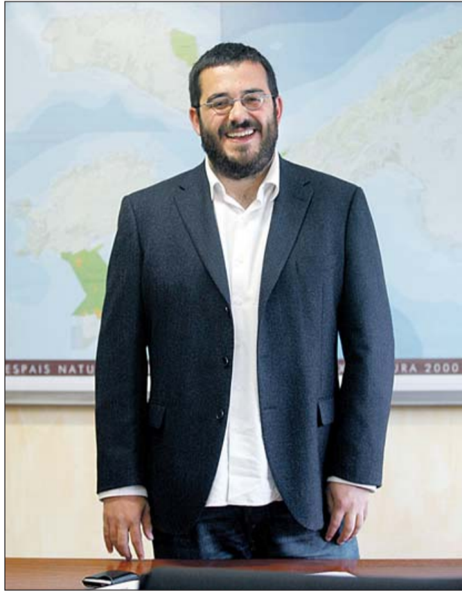
“Son Bosc es una de las zonas de mayor biodiversidad”.

—En todo caso esta pregunta la debería responder el equipo anterior. Lo que le puedo decir es que el actual equipo de la conselleria de Medio Ambiente y Movilidad no tendrá en cuenta posibles presiones urbanísticas o condicionantes de partido a nivel local que puedan variar la responsabilidad de preservar nuestro patrimonio natural. Las decisiones que se han tomado se han ba-