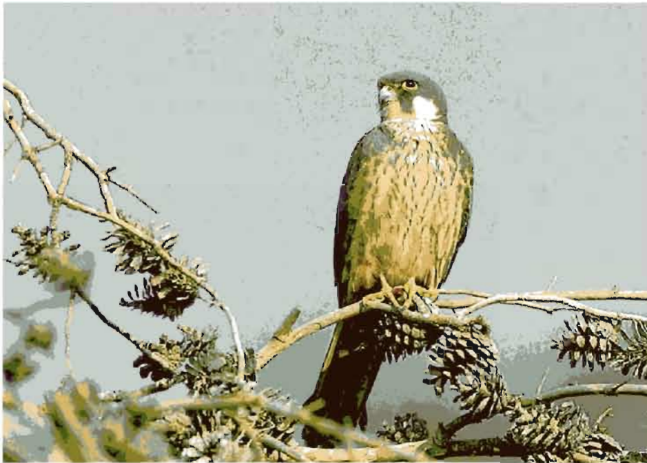
A la izquierda, una pareja de albellerol . Arriba, un ejemplar de falcó mari .

el mantenimiento y el establecimiento de las poblaciones de aves silvestres y aves migratorias de llegada regular, así como de sus huevos y nidos, y se incluyen en la red europea denominada Red Natura 2000. Una ZEPa es, por lo tanto, una figura europea de protección.