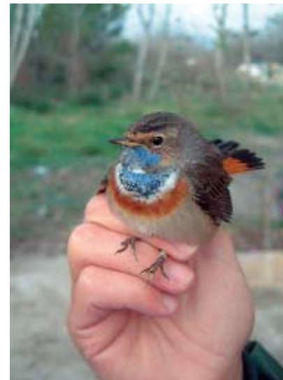
Blaveta- Luscinia svecica anellada a s'Albufera

Els nins tocaren i alliberaren alguns dels aucells agafats, i els pares i padrins passaren una bona estona entre canyes, polls, tamarells i la vella fàbrica de paper. Tots ells acabaren amb un bon somriure. Fet que ens engresca a seguir repetint l'experiència.