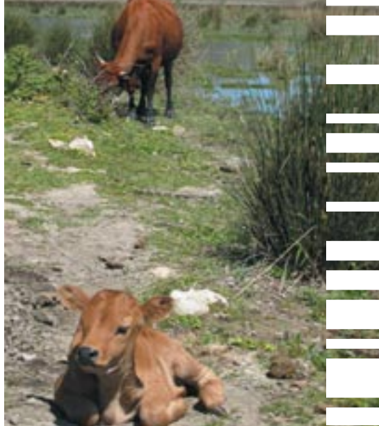
Vedell de vaca mallorquina.

A tal efecte s'ha creat un tancat per a que el bestiar no pugui menjar-se els brots dels arbres i s'han plantat 40 oms, 5 freixes i 5 polls blancs. Dos mesos després de la sembra la quasi totalitat dels arbres (tots