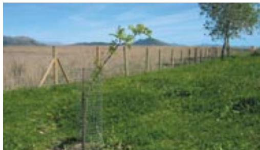
Un dels freixes sembrats aquest hivern a Amarador.

Les activitats de repoblació forestal són molt atractives pels participants, com ens ho demostra l'elevat nombre de persones interessades.