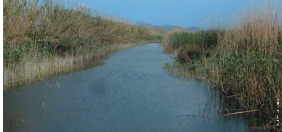
Canal des Sol.

Correu electrònic: parc.albufera@wanadoo.es