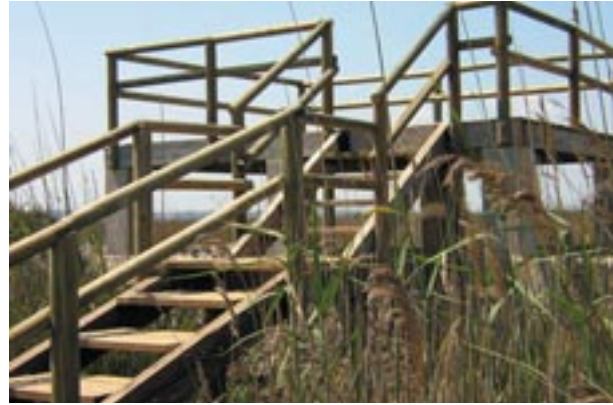
Part final de l'itinerari de l'aguait dels Colombars.