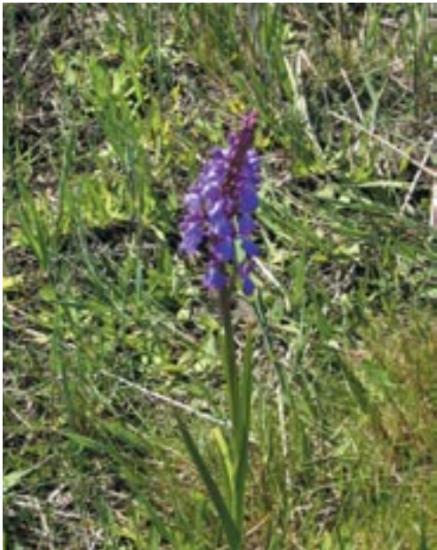
Orquídia de prat ( Orchis palustris ).

Des dels inicis del Parc els grans herbívors domèstics han estat presents en la gestió de l'espai natural. La tasca que tenen encomanada és la reducció de la vegetació d'una manera sostenible, donant lloc a un canvi pausat i positiu de l'espai natural.