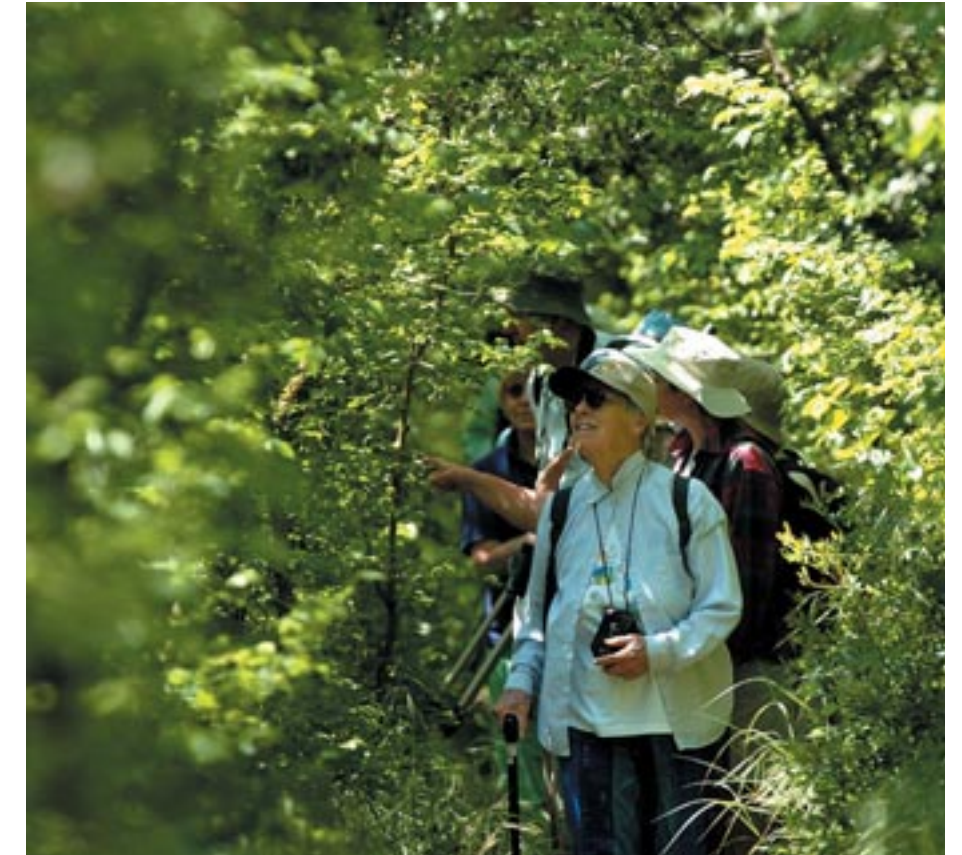
Visitants al bosc de ribera. ©Biel Perelló, 2004.