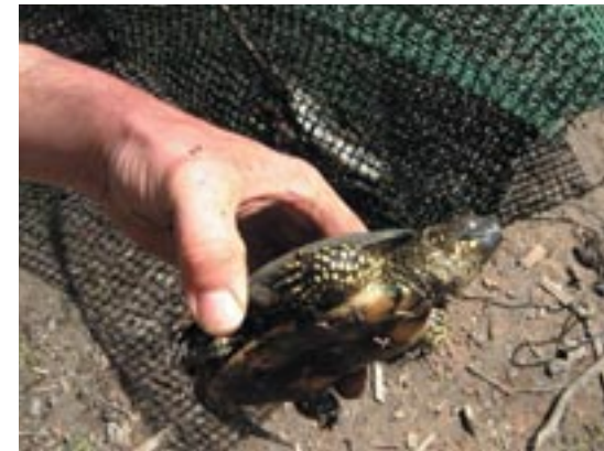
Mascle de tortuga d'aigua trobat mort dins un morenell.

El passat dia 1 d'abril, en una revisió rutinària dels canals, l'agent de Medi Ambient del Parc va trobar quatre morenells en el canal de sa Siurana amb el següent contingut: 3 anguiles, uns tres quilos de llises, dues dotzenes de crancs de riu americà, dues dotzenes de crancs de fang "cama-serrades", i una tortuga autòctona mascle morta ( Emys orbicularis ). És de destacar aquest fet ja que es tracta d'una espècie protegida per la llei, que en el Parc està rebent una forta competència per part de les tortugues de Florida ( Trachemys scripta ), tortugues invasores que han estat alliberades pels voltants del Parc per gent que es cansa de tenir-les a casa i que estan conduïnt a la tortuga de s'Albufera a una situació molt delicada. Els morenells varen ser destruïts, ja que es tracta d'un art de pesca no permès al Parc, i per tant il·legal.