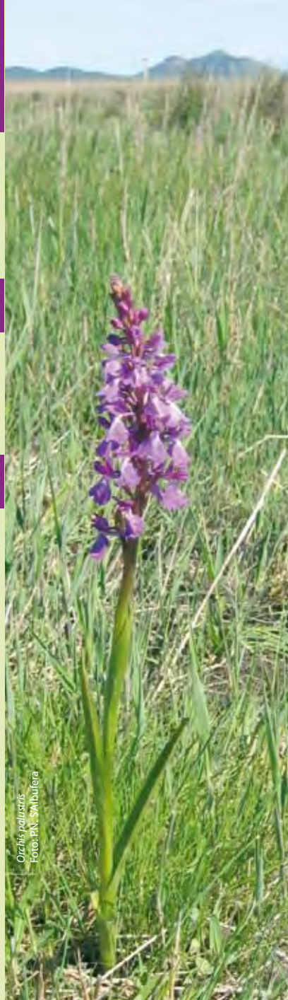
Orchis pallustris

Parc natural de s'Albufera de Mallorca Llista de Correus E-07458 Can Picafort - MALLORCA Tel.: 971 89 22 50 - Fax: 971 89 21 58 (Öffnungszeiten von 9.00 bis 16.00 Uhr) parc.albufera@gmail.com www.mallorcaweb.net/salbufera/