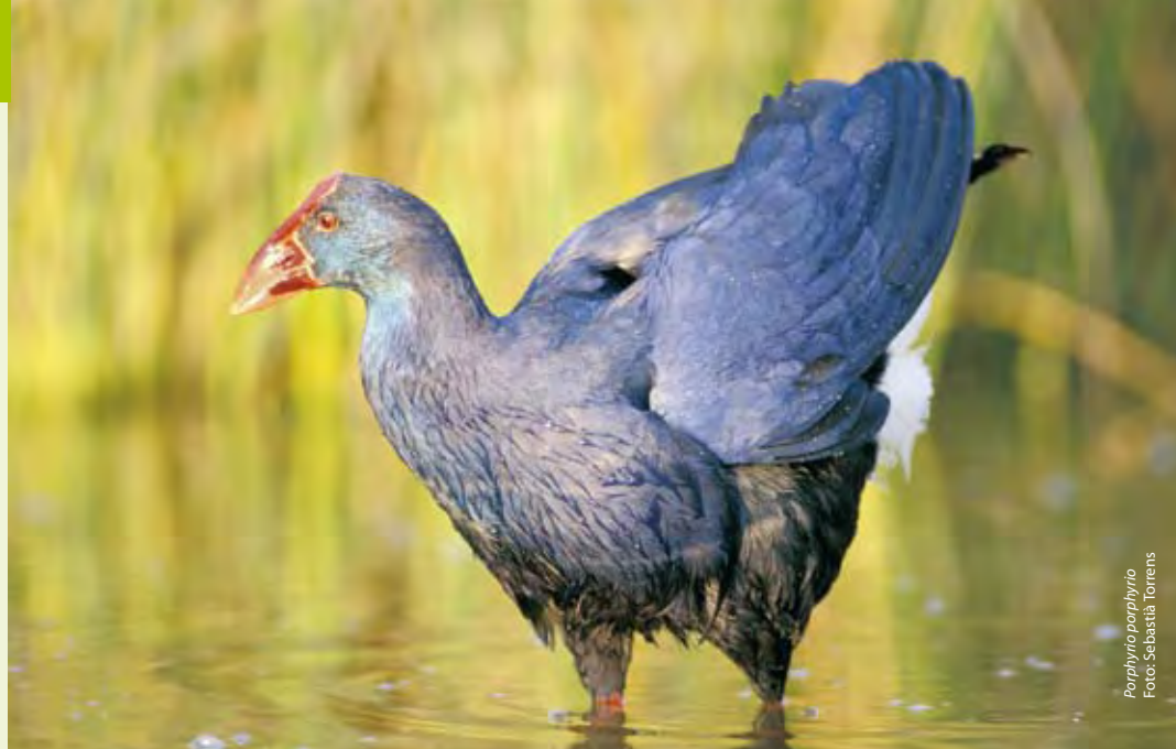
Porphyrio porphyrio

Teile des Graslands stammen zwar noch aus dem Tertiär, das heutige Feuchtgebiet entstand jedoch vor weniger als 100.000 Jahren. Die ans Meer grenzenden Dünen sind jüngeren Datums und etwa 10.000 Jahre alt.