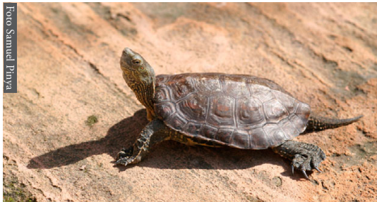
Figura 1. Detalle de uno de los ejemplares capturados en el Parque Natural de s'Albufera de Mallorca.

Key words: Mauremys leprosa , distribution, new records, Natural Park of s'Albufera de Mallorca, Balearic Islands.