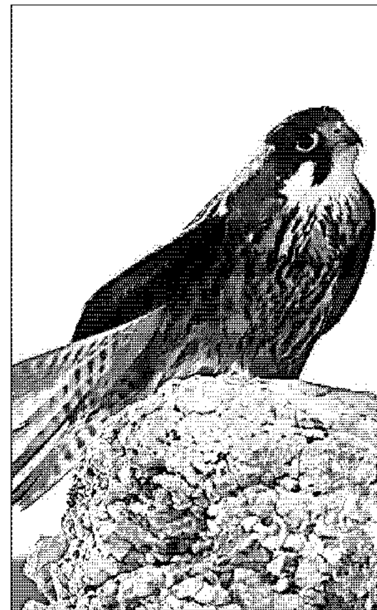
Caza. Los halcones marinos vuelan hasta Son Bosc para alimentarse de los escarabajos. El ornitólogo Rafel Mas explicó las características de esta especie.