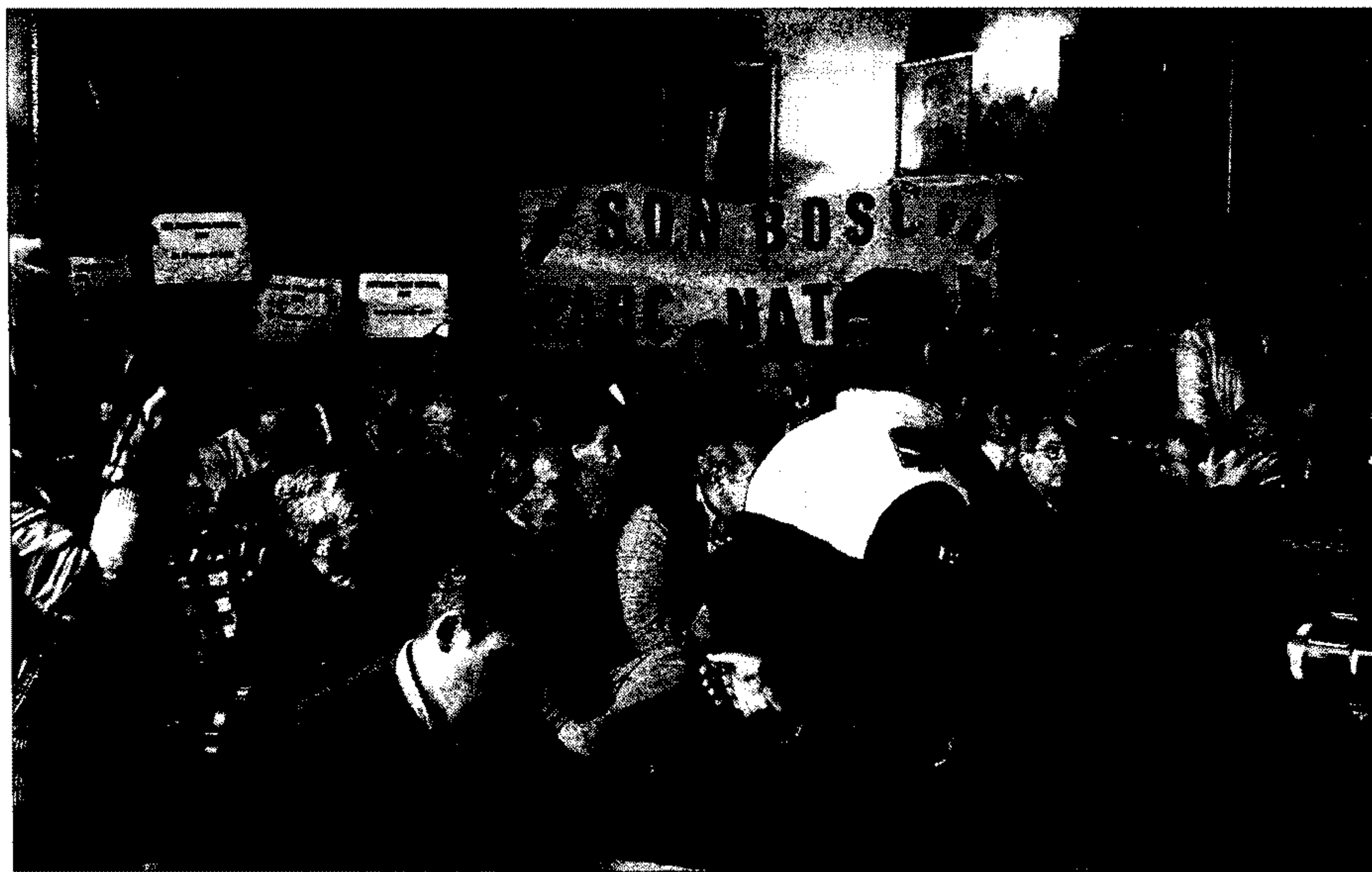
La sala de plenos del Ayuntamiento de Muro, ayer, con los vecinos asistentes enfrentados. / ENRIQUE CALVO

El líder de la coalición PSOE-Entesa señaló que el Pleno constituía «una escenificación del incumplimiento del pacto de gobierno» y volvió a recordar que el campo de golf infringe las Directrices de Ordenación Territorial (DOT), las cuales prohíben la construcción de este tipo de instalaciones a