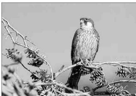
Imagen del halcón marino.