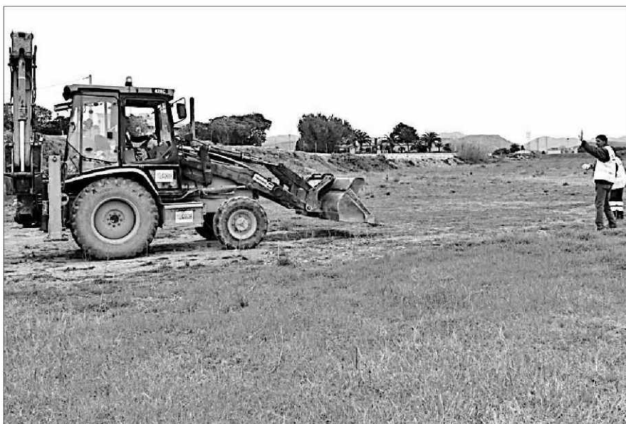
Terrenos de Son Bosc, donde ya habían empezado las obras.