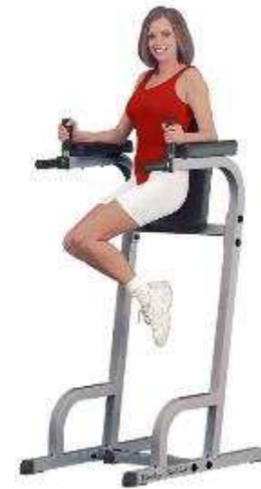
GKR60 Máquina multifunción (Abdominales, Fondos)